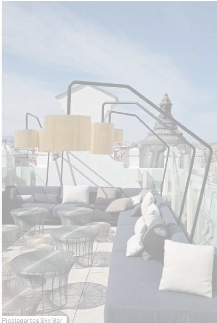
Picalagartos Sky Bar