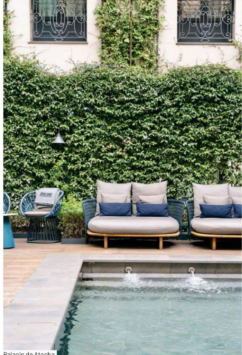
Palacio de Atocha